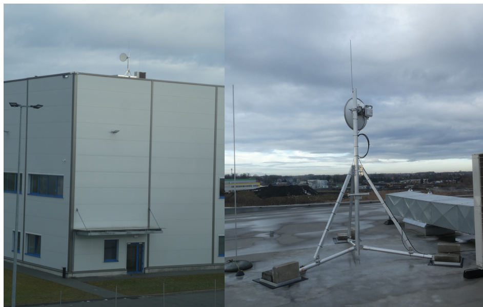
Widok obiektu wraz z zainstalowanym zespołem antenowym