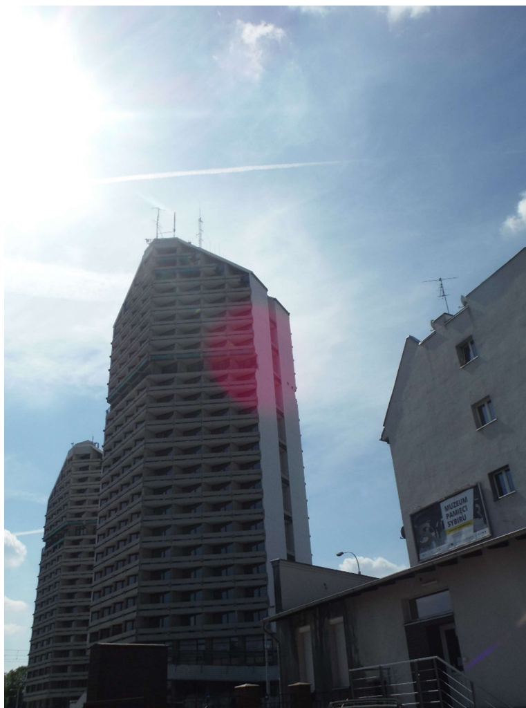
Zdjęcie 1 Badany obiekt