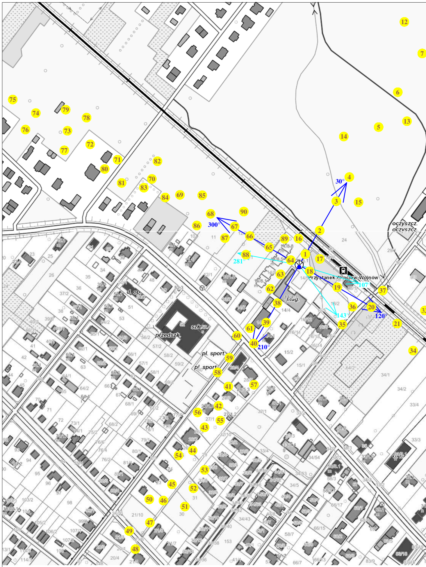
Rys. 2 Lokalizacja pionów pomiarowych