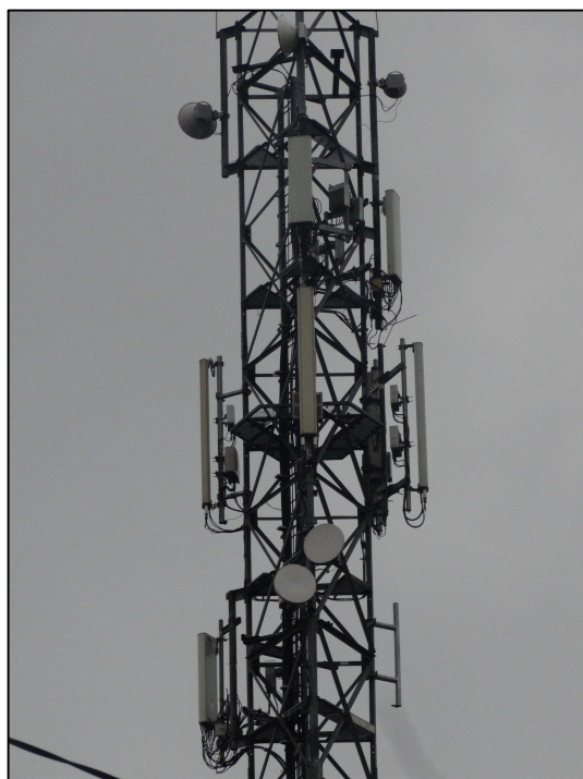
Rys. 4 Widok badanego obiektu