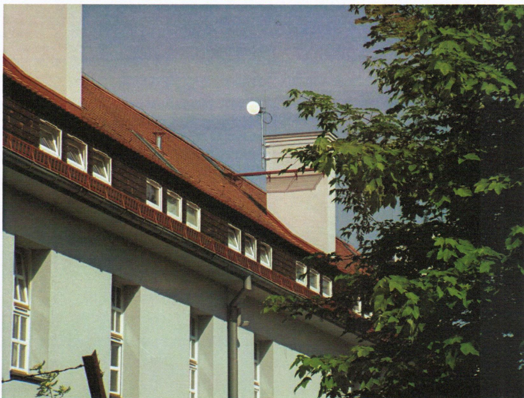
Fot. 1. OM Wrocław / ul. Cichociemnych – widok anteny linii radiowej na dachu budynku