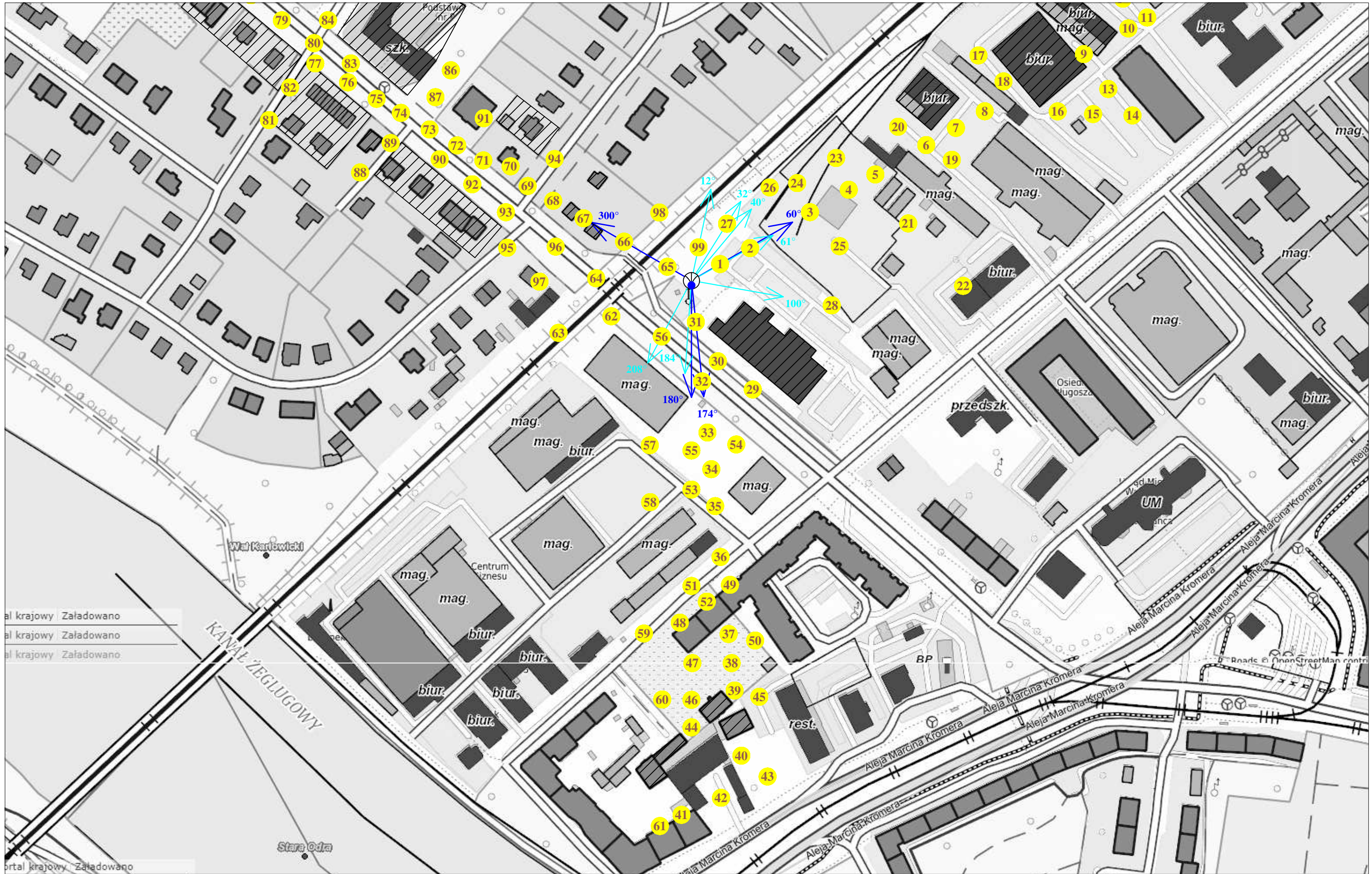
Rys. 3 Lokalizacja pionów pomiarowych

portal krajowy Załadowano portal krajowy Załadowano portal krajowy Załadowano portal krajowy Załadowano