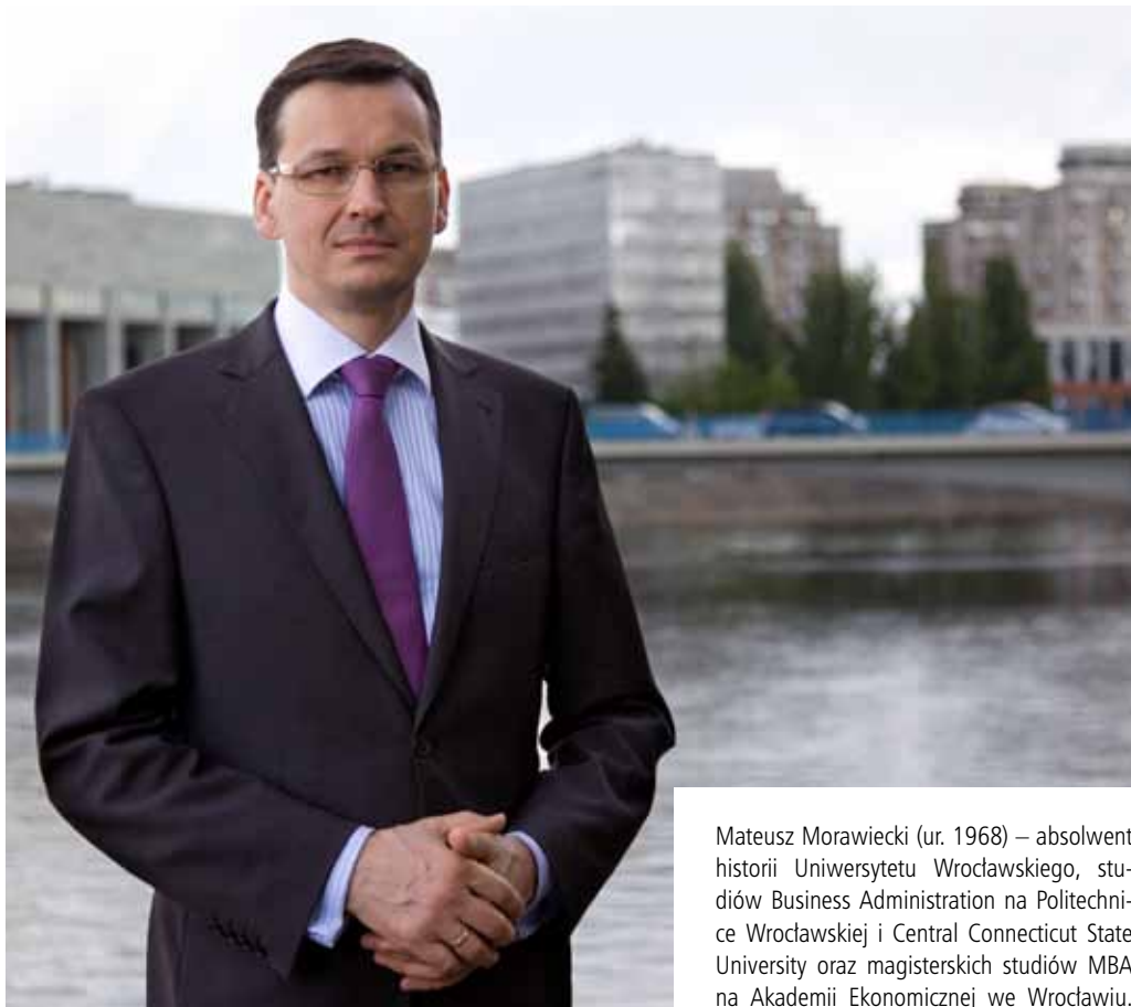
Mateusz Morawiecki (ur. 1968) – absolwent historii Uniwersytetu Wrocławskiego, studiów Business Administration na Politechnice Wrocławskiej i Central Connecticut State University oraz magisterskich studiów MBA na Akademii Ekonomicznej we Wrocławiu.