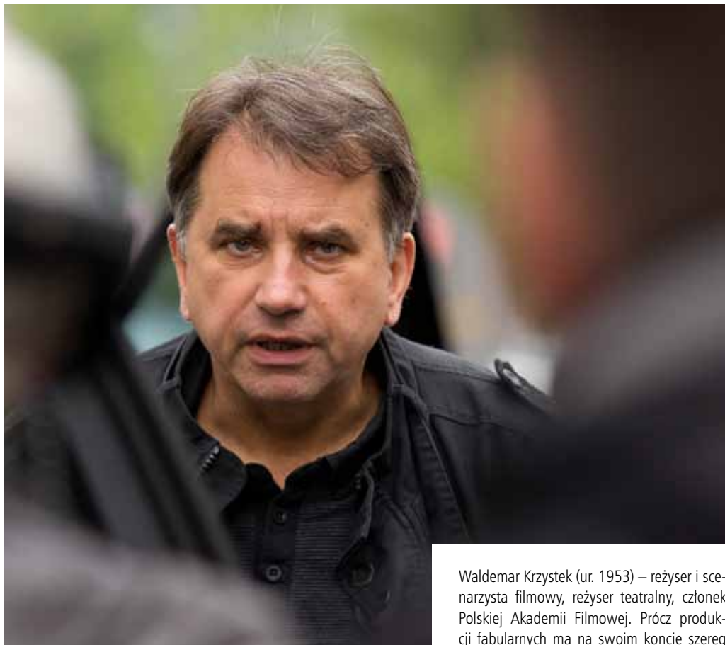
Waldemar Krzystek (ur. 1953) – reżyser i scenarzysta filmowy, reżyser teatralny, członek Polskiej Akademii Filmowej. Prócz produkcji fabularnych ma na swoim koncie szereg