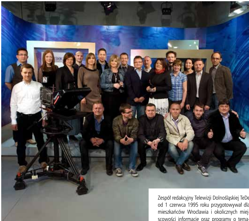
Zespół redakcyjny Telewizji Dolnośląskiej TeDe od 1 czerwca 1995 roku przygotowuje dla mieszkańców Wrocławia i okolicznych miejscowości informacje oraz programy o tema-