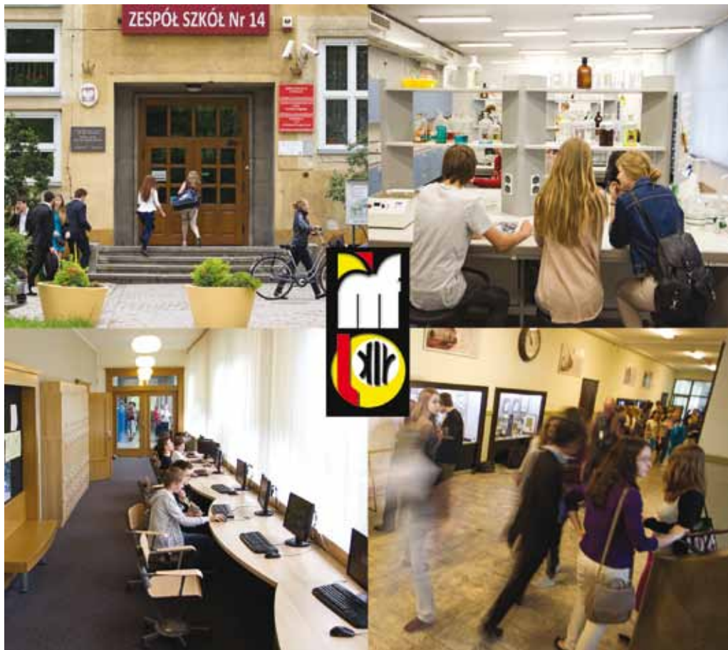
Liceum Ogólnokształcące nr XIV im. Polonii Belgijskiej

Liceum Ogólnokształcące nr XIV im. Polonii Belgijskiej we Wrocławiu powstało w 1974 roku. Obecnie wchodzi w skład Zespołu Szkół nr 14 we Wrocławiu. Od samego początku celem placówki był jak najlepszy poziom kształcenia oraz wychowania młodzieży, wszechstronne przygotowanie jej do podjęcia studiów wyższych oraz pomoc w jak najpełniejszym rozwoju jej zainteresowań i pasji. Dzięki temu szkoła jest postrzegana jako miejsce szczególne i wyjątkowe, gdzie młodzieżczy zapał spotyka się każdorazowo z pedagogicznym doświadczeniem i życzliwością.