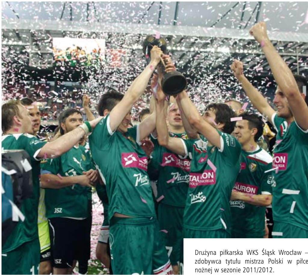
Drużyna piłkarska WKS Śląsk Wrocław – zdobywca tytułu mistrza Polski w piłce nożnej w sezonie 2011/2012.