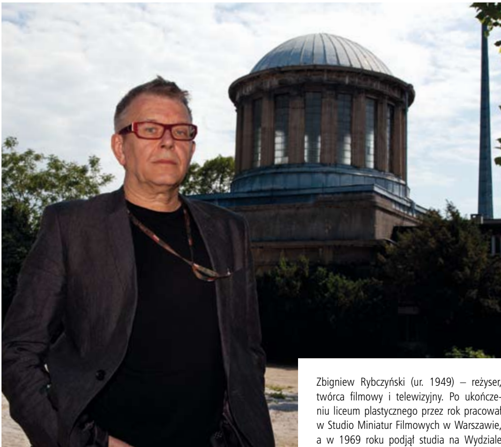
Zbigniew Rybczyński (ur. 1949) – reżyser, twórca filmowy i telewizyjny. Po ukończeniu liceum plastycznego przez rok pracował w Studio Miniatur Filmowych w Warszawie, a w 1969 roku podjął studia na Wydziale

Operatorskim w Państwowej Wyższej Szkole Filmowej, Telewizyjnej i Teatralnej w Łodzi. Był współzałożycielem i jednym z filarów awangardowej grupy twórczej Warsztat Formy Filmowej.