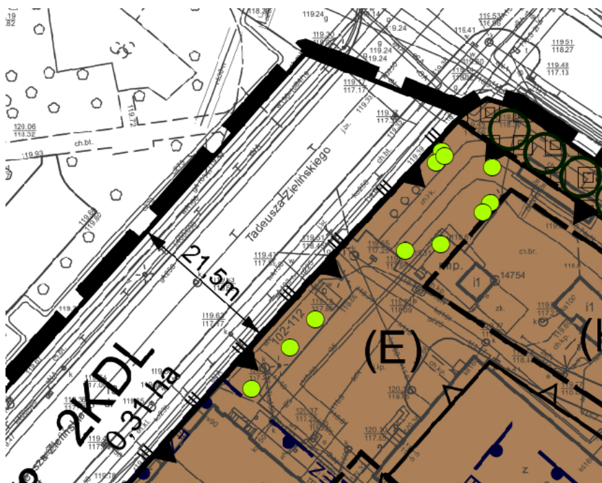
Ryc. 1. Drzewa proponowane do zachowania od strony ul. Tadeusza Zielińskiego.

Ponadto należy rozważyć możliwość odstąpienia od zabudowy lub odsunięcia linii zabudowy zaprojektowanych budynków w taki sposób, aby ochronić rosnące na terenie planu drzewa. W szczególności wskazuje się drzewa wyróżnione na rycinach 1 - 2.