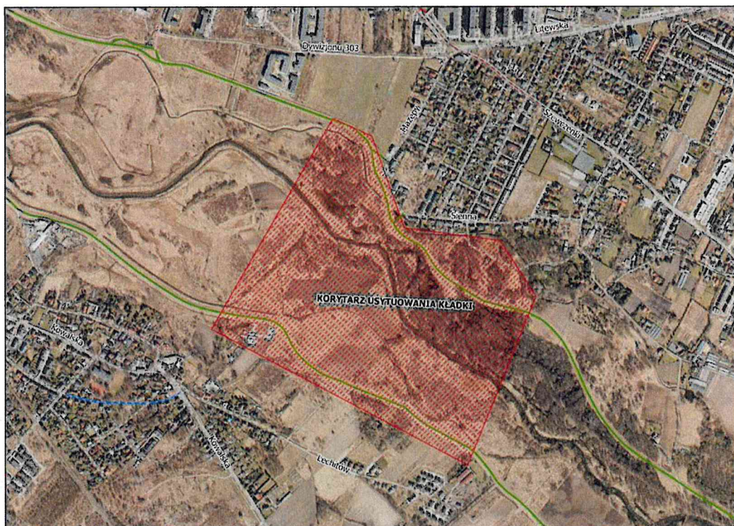
rysunek 1. Korytarz usytuowania kładki.

Tak. Wykonawca będzie miał za zadanie opracowanie tzw. Studium korytarzowego dla lokalizacji kładki. W ramach Studium zadaniem Wykonawcy będzie analiza minimum 2 wariantów lokalizacji kładki (w ramach obszaru wskazanego na rysunku poniżej), by w wyniku analizy porównawczej wybrany został 1, dla którego Wykonawca opracuje projekt koncepcyjny.