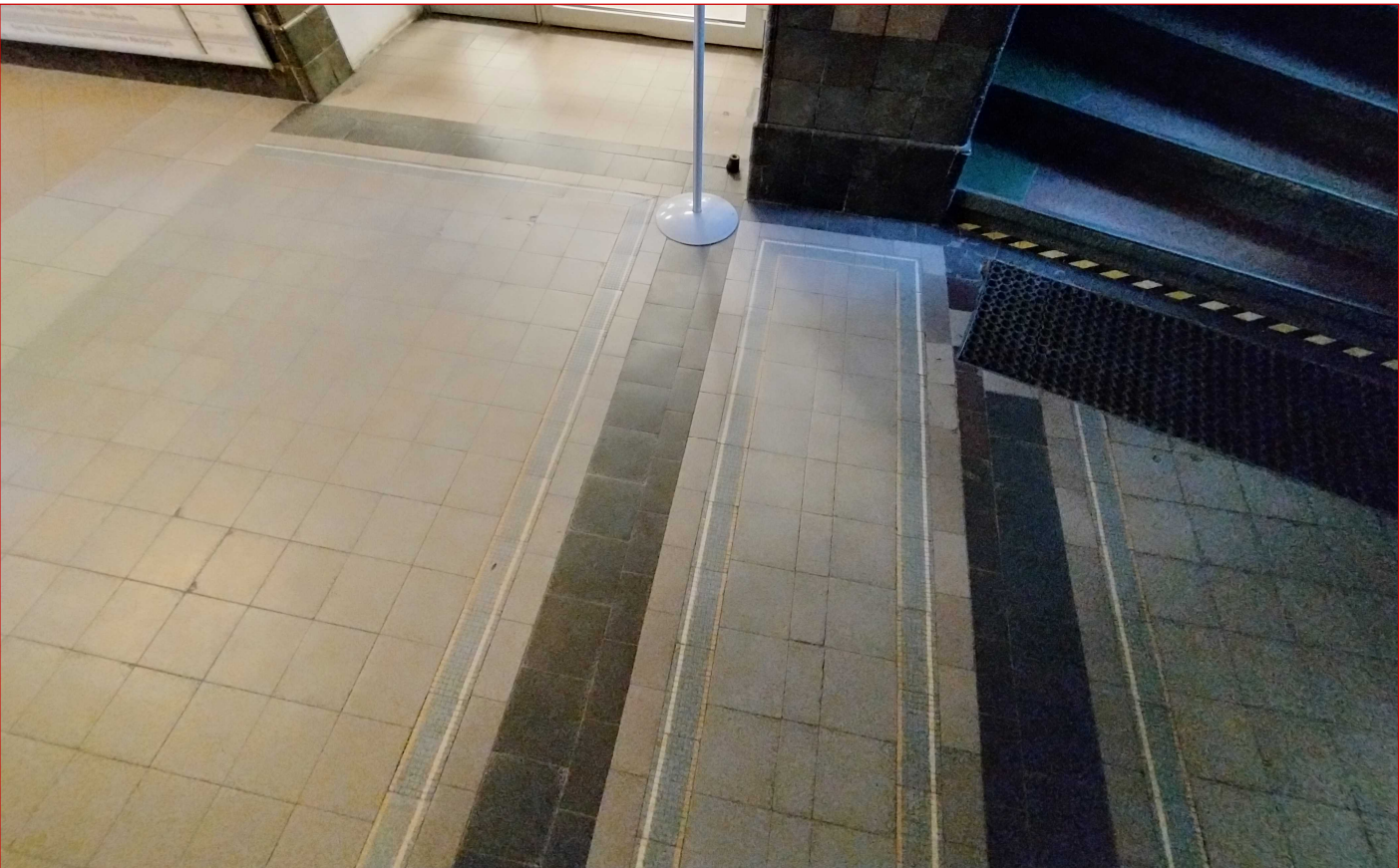
ISTNIEJĄCA POSADZKA HISTORYCZNA