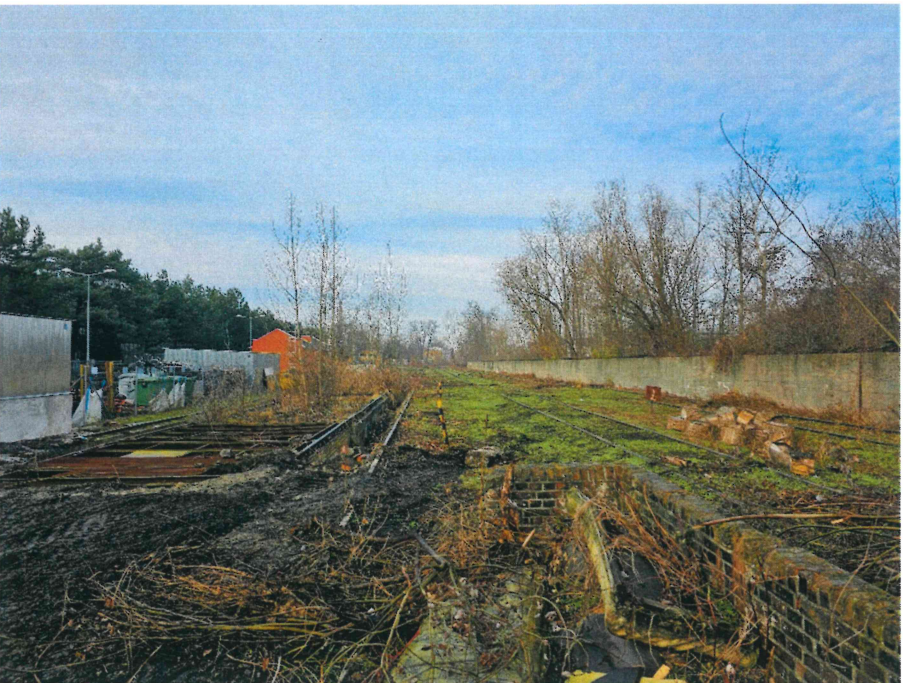
widok na bocznice w kierunku północno-zachodnim