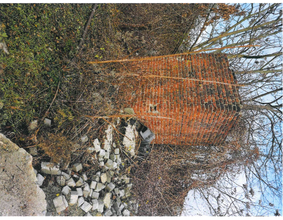
podstawa dźwigu węglowego