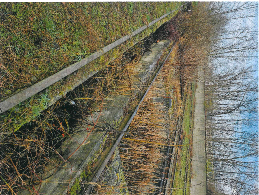
stanowiska obrzadzania parowozów z kanałem oczyszkowym – część środkowa