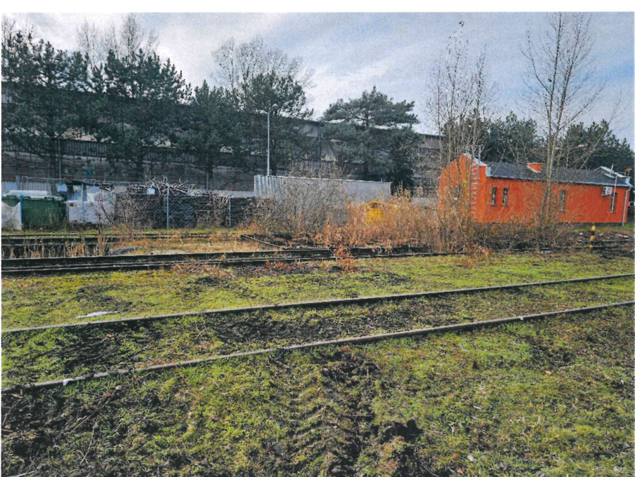
widok na stanowiska obrzadzania parowozów i dawny budynek administracyjny