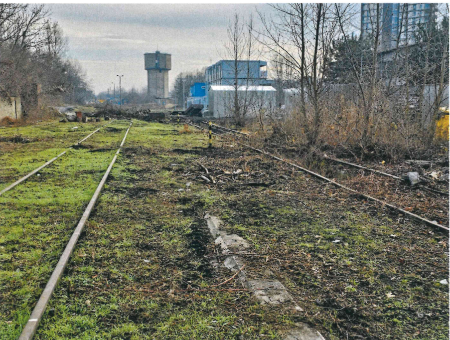
widok na bocznice w kierunku południowo-wschodnim