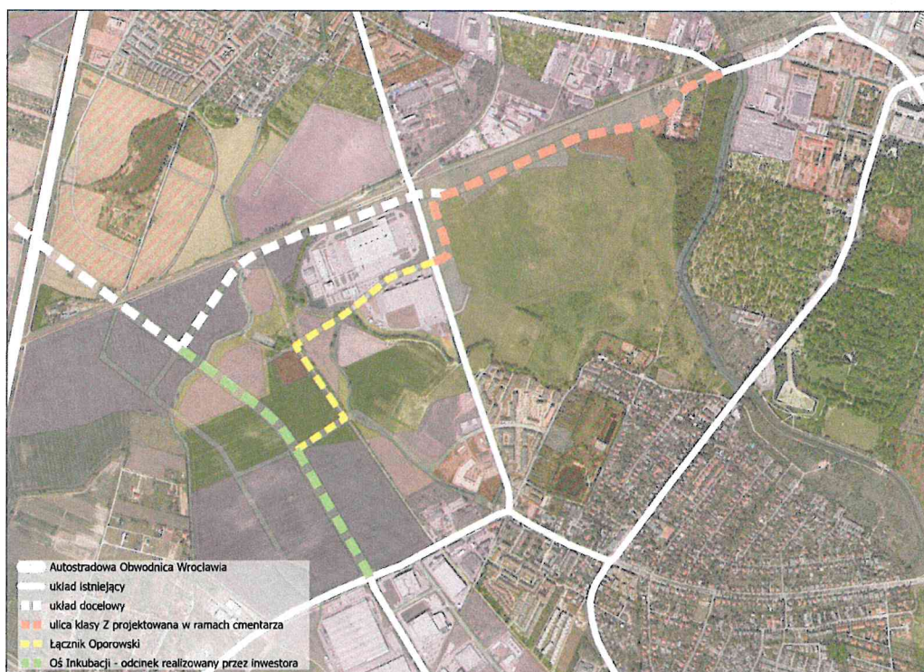
Schemat 1. Planowany układ drogowy w rejonie ul. Awicenny.