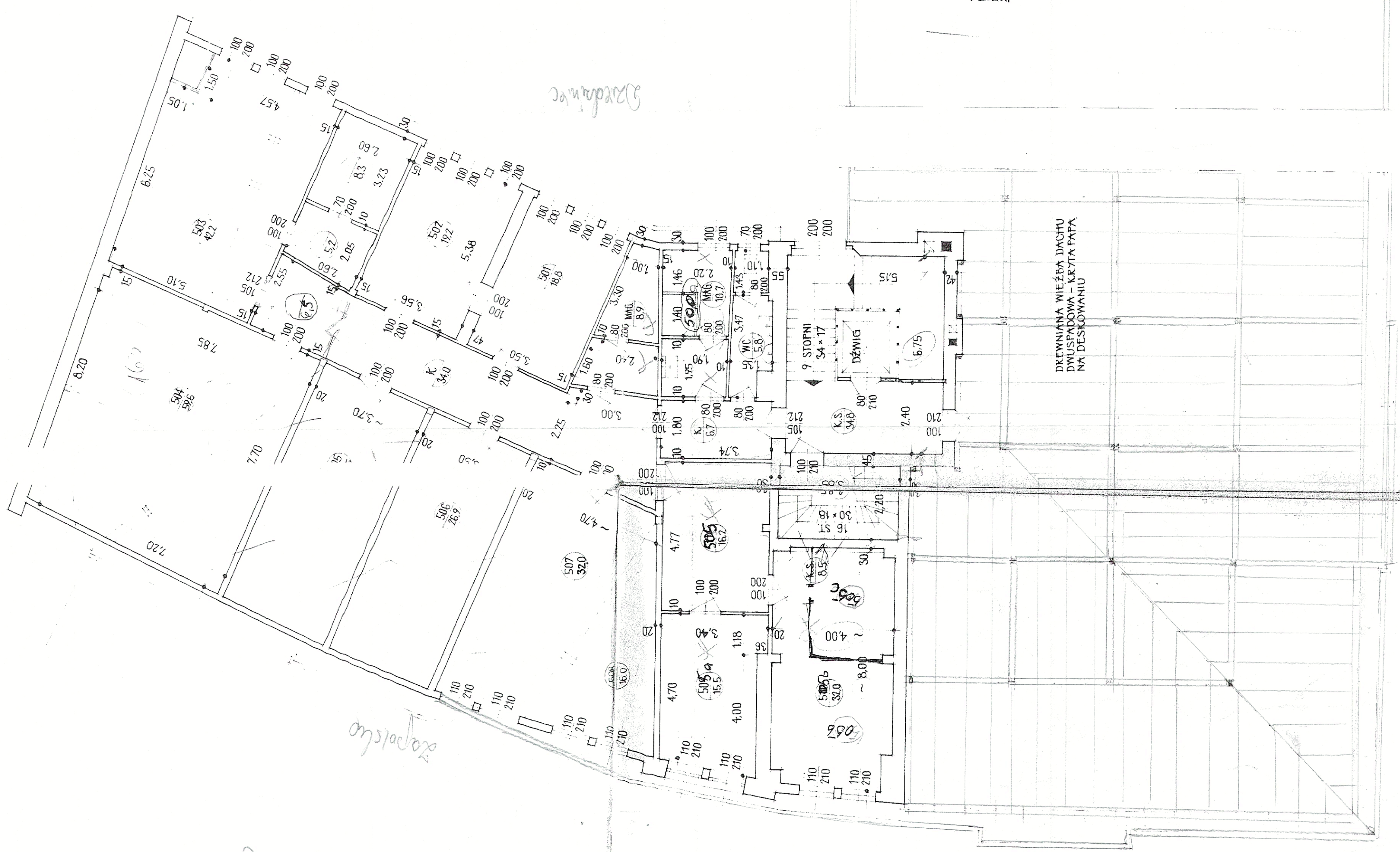
MASZYNOWNIA DZWIĞU 1:100