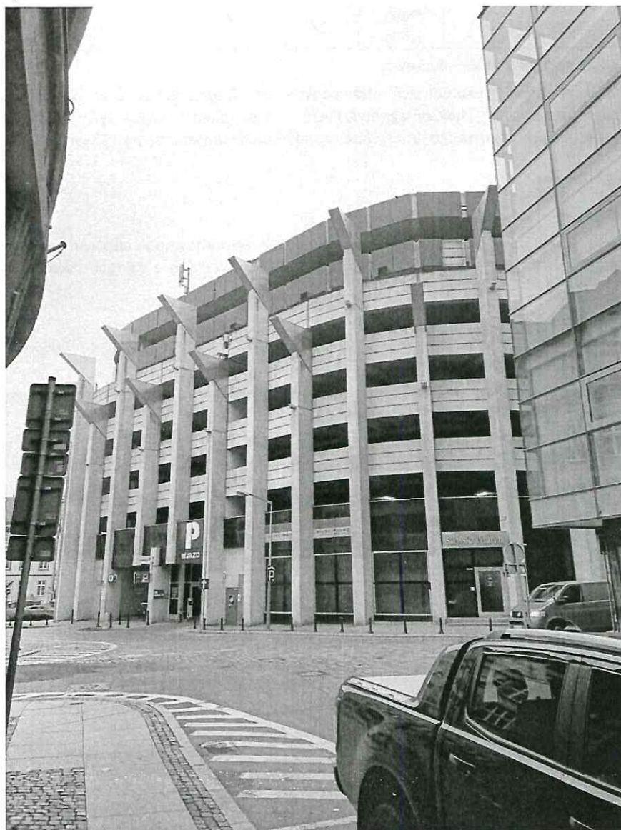
Zdjęcie 1 Badany obiekt

To sprawozdanie zawiera 8 stron i bez pisemnej zgody Kierownika Sundoor Laboratorium Badawczego, nie może być powielane inaczej jak tylko w całości. Egzemplarz elektroniczny (.pdf) jest przechowywany w archiwum Sundoor Laboratorium Badawcze