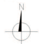
Skala 1:3000 Azymuty anten T-Mobile