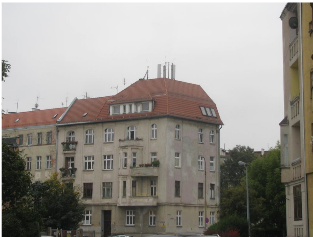
Zat. nr 1: Widok ogólny instalacji radiokomunikacyjnej.