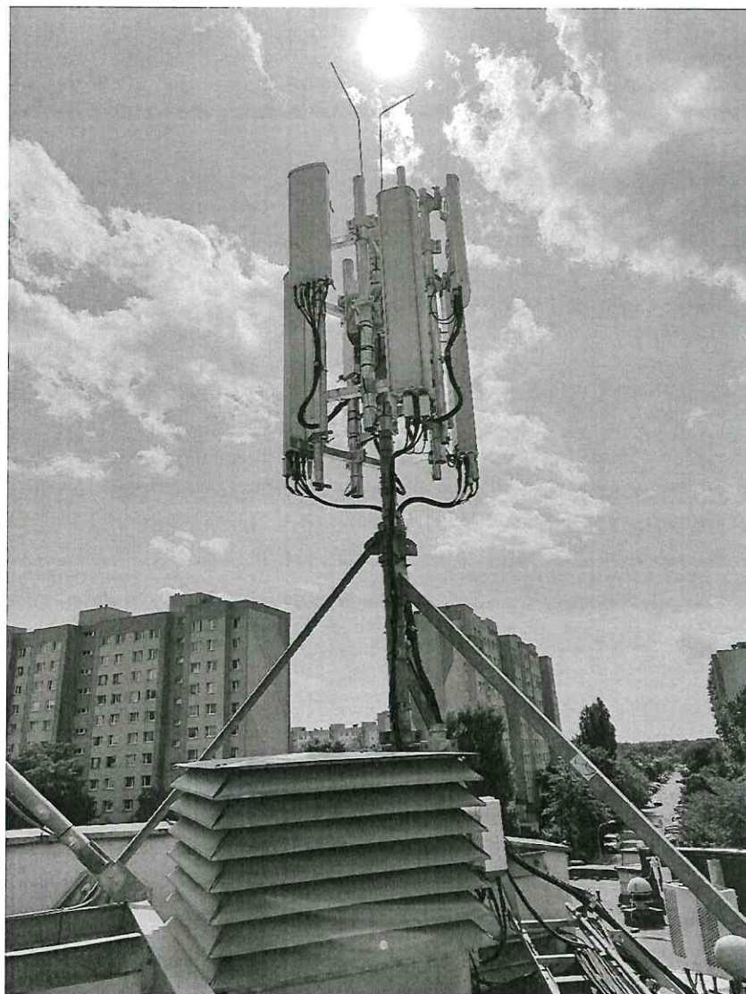
Zdjęcie 1 Badany obiekt

To sprawozdanie zawiera 9 stron i bez pisemnej zgody Kierownika Sundoor Laboratorium Badawcze nie może być powielane inaczej jak tylko w całości. Egzemplarz elektroniczny (.pdf) jest przechowywany w archiwum Sundoor Ławecki Sp. K.